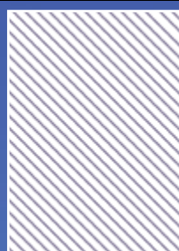
01 PÁGINA 20,32 x 26,67 cm